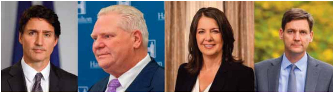
ਜਸਟਿਨ ਟਰੂਡੋ ਪ੍ਰਧਾਨ ਮੰਤਰੀ | ਡੱਗ ਫੋਰਡ ਪ੍ਰੀਮੀਅਰ ਓਨਟਾਰੀਓ | ਡੋਨਾਲਡ ਟਰੰਪ ਅਮਰੀਕਾ | ਡੇਵਿਡ ਓਲੀਵੀ ਪ੍ਰੀਮੀਅਰ ਬੀ.ਸੀ.