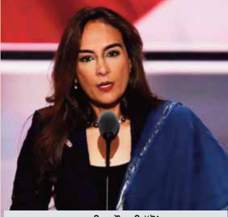
ਹਰਮੀਤ ਕੌਰ ਢਿੱਲੋਂ

ਵਾਸ਼ਿੰਗਟਨ: ਅਮਰੀਕਾ ਦੇ ਨਵੇਂ ਚੁਣੇ ਗਏ ਰਾਸ਼ਟਰਪਤੀ ਡੋਨਲਡ ਟਰੰਪ ਨੇ ਚੰਡੀਗੜ੍ਹ ਵਿੱਚ ਜਨਮੀ ਮਸ਼ਹੂਰ ਵਕੀਲ ਹਰਮੀਤ ਕੌਰ ਢਿੱਲੋਂ ਨੂੰ ਸਹਾਇਕ ਅਟਾਰਨੀ ਜਨਰਲ ਵਜੋਂ ਨਾਮਜ਼ਦ ਕਰਕੇ ਇੱਕ ਵੱਡਾ ਐਲਾਨ ਕੀਤਾ ਹੈ। ਇਸ ਅਹੁਦੇ 'ਤੇ ਨਿਯੁਕਤੀ ਨਾਲ ਉਹ ਅਮਰੀਕਾ ਦੇ ਨਿਆਂ ਵਿਭਾਗ ਵਿੱਚ ਸਿਵਲ ਰਾਈਟਸ ਦੀ ਰੱਖਿਆ ਲਈ ਜ਼ਿੰਮੇਵਾਰੀ ਸਾਂਭਣਗੇ। ਜ਼ਿਕਰਯੋਗ ਹੈ ਕਿ ਹਰਮੀਤ ਕੌਰ ਢਿੱਲੋਂ ਸੈਨਫਰੈਸਿਸਕੋ ਕੈਲੀਫੋਰਨੀਆ ਵਿਖੇ ਲੋਕਾਂ ਨੂੰ ਆਪਣੀਆਂ ਕਾਨੂੰਨੀ ਸੇਵਾਵਾਂ ਦੇ ਰਹੀ ਹੈ। ਹਰਮੀਤ ਢਿੱਲੋਂ, ਜੋ ਫੀਡਮ ਆਫ ਸਪੀਚ ਅਤੇ ਨਾਗਰਿਕ ਅਧਿਕਾਰਾਂ ਦੀ ਰੱਖਿਆ ਲਈ ਜਾਣੀ ਜਾਂਦੀ ਹੈ, ਨੇ ਆਪਣੇ ਕਰੀਅਰ ਦੌਰਾਨ ਤਕਨੀਕੀ ਕੰਪਨੀਆਂ ਵਿਰੁੱਧ ਮੁਹਿੰਮ ਚਲਾਈ। ਉਹਨਾਂ ਦੀ ਰਹਿਨੁਮਾਈ ਹੇਠ ਕਈ ਅਹਿਮ ਮਾਮਲਿਆਂ ਵਿੱਚ ਅਮਰੀਕੀ ਨਾਗਰਿਕਾਂ ਦੇ ਸੰਵਿਧਾਨਕ ਅਧਿਕਾਰਾਂ ਦੀ ਰੱਖਿਆ ਕੀਤੀ ਗਈ।