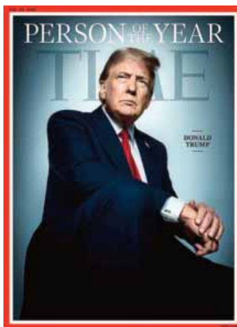
ਦ ਈਅਰ' ਚੁਣਿਆ ਗਿਆ, ਟਰੰਪ ਨੇ ਟਵਿੱਟਰ 'ਤੇ ਕਿਹਾ ਕਿ ਟਾਈਮ ਮੈਗਜ਼ੀਨ ਨੇ ਇੱਕ ਐਸੀ ਹਸਤੀ ਨੂੰ ਚੁਣਿਆ ਹੈ ਜੋ

ਜ਼ਿਕਰਯੋਗ ਹੈ ਕਿ ਡੋਨਾਲਡ ਟਰੰਪ ਅਤੇ ਟਾਈਮ ਮੈਗਜ਼ੀਨ ਦੇ ਰਿਸ਼ਤੇ ਹਮੇਸ਼ਾ ਹੀ ਤਨਾਅ ਭਰੇ ਰਹੇ ਹਨ। 2012 ਵਿੱਚ ਟਰੰਪ ਨੇ ਮੈਗਜ਼ੀਨ ਦੀ ਨਿੰਦਾ ਕੀਤੀ ਸੀ ਜਦੋਂ ਉਹਨਾਂ ਨੂੰ 100 ਸਭ ਤੋਂ ਸ਼ਕਤੀਸ਼ਾਲੀ ਵਿਅਕਤੀਆਂ ਵਿੱਚ ਸ਼ਾਮਿਲ ਨਹੀਂ ਕੀਤਾ ਗਿਆ। 2015 ਵਿੱਚ, ਜਦੋਂ ਜਰਮਨੀ ਦੀ ਚਾਂਸਲਰ ਐਂਜਲਾ ਮਰਕਲ ਨੂੰ 'ਪਰਸਨ ਆਫ