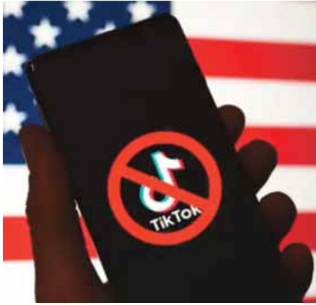
ਵੇਚਣ ਦਾ ਹੁਕਮ ਦਿੱਤਾ।

ਅਮਰੀਕਾ ਦੇ ਰਾਸ਼ਟਰਪਤੀ ਜੋ ਬਾਈਡਨ ਨੇ ਟਿਕਟਾਕ 'ਤੇ ਪਾਬੰਦੀ ਲਗਾਉਣ ਲਈ ਇੱਕ ਵਿਸ਼ੇਸ਼ ਕਾਨੂੰਨ ਬਣਾਇਆ ਸੀ। ਕਾਨੂੰਨ ਪੇਸ਼ ਕਰਨ ਦੌਰਾਨ ਟਿਕਟਾਕ ਨੂੰ ਰਾਸ਼ਟਰੀ ਸੁਰੱਖਿਆ ਅਤੇ ਉਪਭੋਗਤਾ ਦੇ ਡਾਟਾ ਲਈ ਖਤਰਾ ਦੱਸਿਆ ਗਿਆ। ਅਮਰੀਕੀ ਸੈਨੇਟ ਨੇ ਬਿੱਲ ਨੂੰ 79-18 ਵੋਟਾਂ ਨਾਲ ਪਾਸ ਕੀਤਾ। ਬਾਈਡਨ ਨੇ 24 ਅਪ੍ਰੈਲ ਨੂੰ ਇਸ ਬਿੱਲ 'ਤੇ ਹਸਤਾਖਰ ਕਰਕੇ ਬਾਇਟਡਾਂਸ ਨੂੰ 9 ਮਹੀਨਿਆਂ ਵਿੱਚ ਆਪਣੀ ਹਿੱਸੇਦਾਰੀ