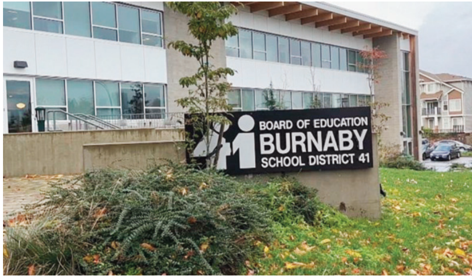
"ਇਹ ਅਸਾਨ ਫੈਸਲਾ ਨਹੀਂ ਸੀ, ਪਰ ਇਹ ਜ਼ਰੂਰੀ ਸੀ। ਸਾਨੂੰ ਮੌਜੂਦਾ ਵਿਦਿਆਰਥੀਆਂ ਅਤੇ ਅਗਲੇ ਸਾਲ ਦੇ ਅੰਦਾਜ਼ੇ ਦੇ ਮੁਤਾਬਕ ਆਉਣ ਵਾਲੇ ਵਿਦਿਆਰਥੀਆਂ ਲਈ ਵਿਵਸਥਾ ਕਰਨ ਦੀ ਜ਼ਿੰਮੇਵਾਰੀ ਨਿਭਾਉਣੀ