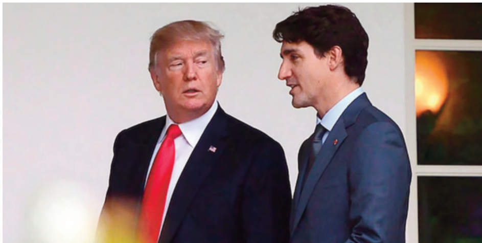
ਜਿਵੇਂ ਕੈਨੇਡਾ ਅਮਰੀਕਾ ਤੋਂ ਆਉਣ ਵਾਲੇ ਨਸ਼ਿਆਂ ਬਾਰੇ ਚਿੰਤਤ ਹੈ।

ਇਸ ਡਿਨਰ ਦੌਰਾਨ ਟਰੰਪ ਅਤੇ ਟਰੂਡੋ ਨੇ ਟੈਰਿਫ਼, ਡਰੱਗਜ਼ ਅਤੇ ਬਾਰਡਰ ਸੁਰੱਖਿਆ ਬਾਰੇ ਗੱਲਬਾਤ ਕੀਤੀ। ਟਰੰਪ ਨੇ ਕੈਨੇਡਾ ਵਲੋਂ ਅਮਰੀਕਾ ਲਈ ਡਰੱਗਜ਼ ਅਤੇ ਪਰਵਾਸੀਆਂ ਦੀ ਸਥਿਤੀ 'ਤੇ ਚਿੰਤਾ ਜ਼ਾਹਰ ਕੀਤੀ,